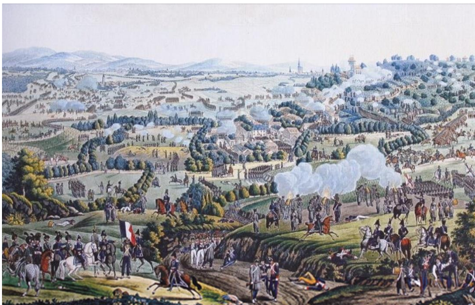
De slag van La Souffel op 28 juni 1815, gravure van A.F. von Perglas en L. Schnell

Het nieuws over de aankomst van Louis XVIII in Parijs bereikte Straatsburg op 13 juli. Een wapenstilstand werd gesloten op 22 juli, met betrekking tot het Rijnleger en tien regionale bolwerken, die elk op hun posities bleven in afwachting van nieuws.