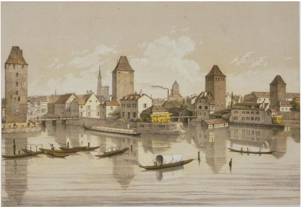
Panorama van Straatsburg met de “quatre tours des ponts couverts” in 1860. Schilderij van Léon Auguste Asselineau. Bibliothèque nationale et universitaire de Strasbourg

In 1814 trokken de geallieerden Frankrijk binnen en werd Antwerpen en Straatsburg belegerd en Parijs veroverd. Napoleon werd verbannen naar het eiland Elba, maar keerde in 1815 nog eens terug voor de “100 dagen”, waarbij Straatsburg nogmaals werd belegerd. Na de nederlaag in Waterloo werd Napoleon definitief verbannen naar het eiland Sint-Helena.