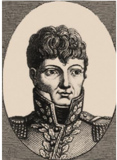
Graaf Jean-Baptiste Broussier

Het nieuws van de afzetting van Napoleon kwam toe op 9 april en werd publiek gemaakt de 14 de . De militaire operaties werden snel daarna gestaakt, maar het beleg werd pas op 5 mei 1814 opgeheven. De militaire operaties hadden slechts weinig slachtoffers gemaakt, in tegenstelling tot de tyfus die zich eind december in de stad had verspreid en duizenden doden had veroorzaakt.