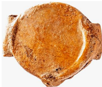
Driepuntzegel, 19e-20e eeuw; Belgische vondst