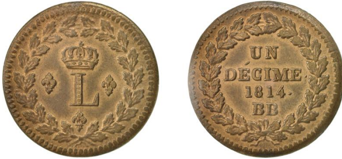
Een deciem 1814 Lodewijk XVIII, Straatsburg, brons Ø 31,5 mm, 22 g

De stad Straatsburg die ligt aan de linkeroever van de Rijn op de grens van Frankrijk en Duitsland kende een bewogen geschiedenis. Oorspronkelijk was er een Keltische nederzetting. De Romeinen bouwden er een militair kamp in 12 v.C. en noemden de stad Argentoratum. In de 4 de eeuw werd de stad bij het Frankische Rijk ingelijfd en werd toen Strateburgum genoemd.