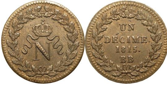
Een deciem 1815 Napoleon, Straatsburg, brons Ø 31,5 mm, 22 g

Een decreet van 8 augustus van de regering, waarin de financiële bepalingen bekeken werden, stelde negen punten voor, inclusief de productie van 150.000 frank van “gros sous”, om tegemoet te komen aan de onmiddellijke financiële behoeften. De slagaantallen voor de deciem van 1815 zijn 1.266.920 munten. De deciemmen geslagen in 1815 waren opnieuw van het type “gekroonde N”. Het slaan van het type met de “L” werd hervat bij de terugkeer van Louis XVIII, bekend op 13 juli in Straatsburg. Deze productie, die tot in 1816 voortduurde om het gebrek aan kleine geldmiddelen te compenseren, werd door latere decreten en circulaires officieel gelegaliseerd.