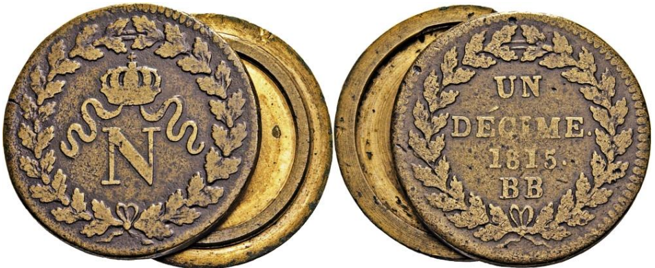
boites de forçat

Een decreet van 8 augustus van de regering, waarin de financiële bepalingen bekeken werden, stelde negen punten voor, inclusief de productie van 150.000 frank van “gros sous”, om tegemoet te komen aan de onmiddellijke financiële behoeften. De slagaantallen voor de deciem van 1815 zijn 1.266.920 munten. De deciemmen geslagen in 1815 waren opnieuw van het type “gekroonde N”. Het slaan van het type met de “L” werd hervat bij de terugkeer van Louis XVIII, bekend op 13 juli in Straatsburg. Deze productie, die tot in 1816 voortduurde om het gebrek aan kleine geldmiddelen te compenseren, werd door latere decreten en circulaires officieel gelegaliseerd.