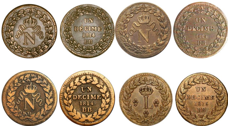
Varianten zonder punten, klein jaartal, zonder punt na DÉCIME of zonder accent op de E

Er bestaan ook verschillende varianten van de keerzijde van deze munten. Meest voorkomend zijn deze met een punt na DÉCIME én na het jaartal. Soms ontbreken beide punten of dat na DÉCIME, of het accent op de E. Er bestaat ook een variant met een klein jaartal 1814. Niet alle combinaties met de twee voorzijden zijn voorkomend.